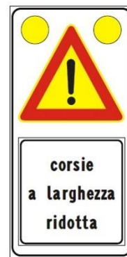
Figura II 391c Art. 31