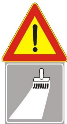
Figura II 391 Art. 31